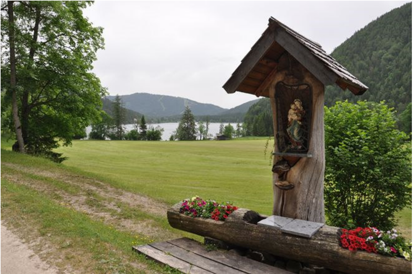
Marterl beim Erlaufsee