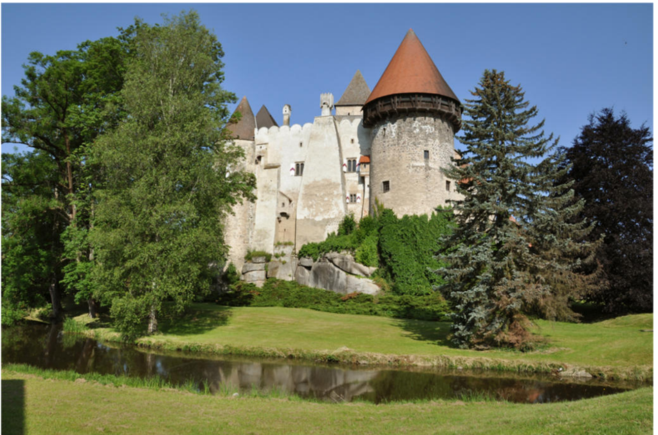
Die Burg in Heidenreichstein