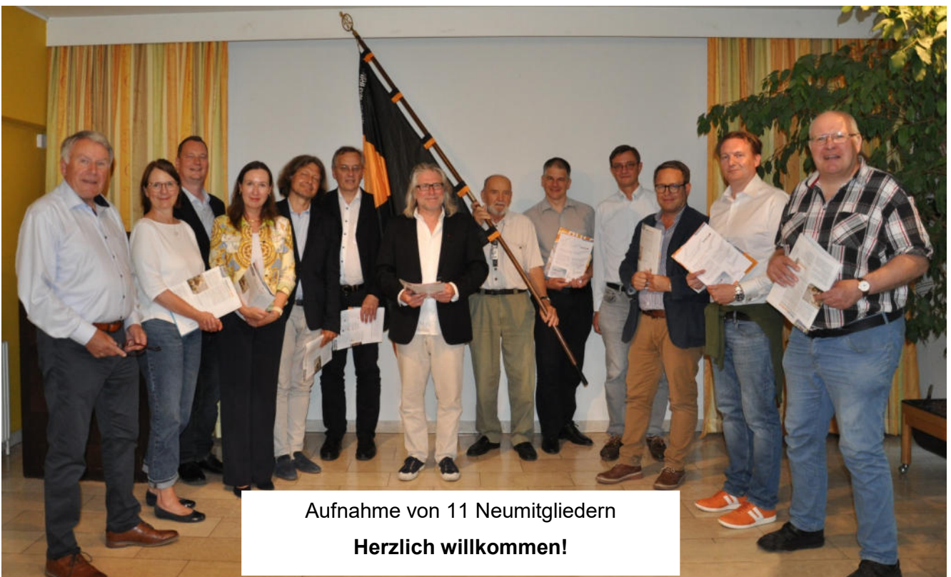
Aufnahme von 11 Neumitgliedern Herzlich willkommen!

So weit in Kurzfassung das Wichtigste von unserer Generalversammlung. Detaillierter informieren konnten sich natürlich jene Mitglieder, welche persönlich dabei sein konnten.