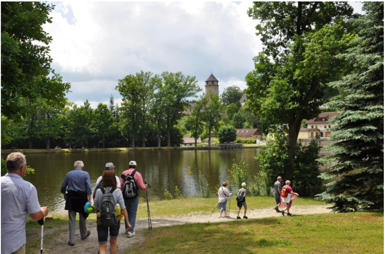
Die Kolping-Wandergruppe beim Herrensee

Das Wetter war herrlich und wir machten eine gemütliche Wanderung rund um den Herrensee. Nach rund zwei Stunden in schöner Landschaft kehrten wir im Gasthaus Kaufmann für ein sehr gutes Mittagessen ein.